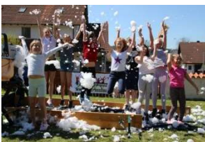
Foto Download in druckfähiger Auflösung auf https://www.minicrosslauf.de/minicross.html#Medien-Information

Weitere Informationen und Anmeldung für Teilnehmer und Helfer auf www.minicrosslauf.de