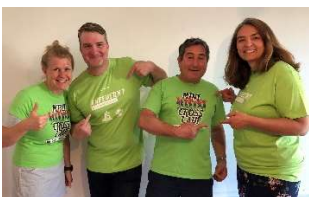
Foto Download in druckfähiger Auflösung auf https://www.minicrosslauf.de/minicross.html#Medien-Information

Weitere Informationen und Anmeldung für Teilnehmer auf www.minicrosslauf.de