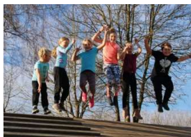
Foto Download in druckfähiger Auflösung auf https://www.minicrosslauf.de/minicross.html#Medien-Information

Weitere Informationen und Anmeldung für Teilnehmer und Helfer auf www.minicrosslauf.de